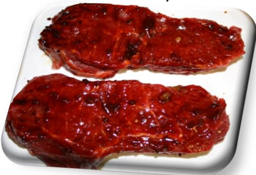
Marinert biff av ytrefilet

Ytrefilet i skiver. Pensle på Hickory marinade eller annen marinade som egner seg for storfekjøtt.